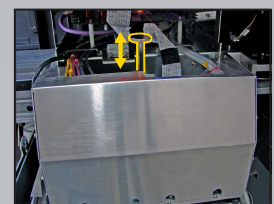
Altura de cabezal ajustable.