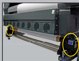
Sistema take-up automático con 2 motores sincronizados de tensión constante ajustable.