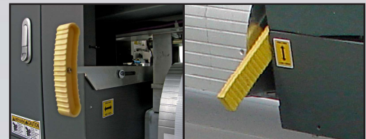
2 palancas, adelante y atrás, que facilita el montaje del material.

Determinados a innovar, te presentamos la más avanzada tecnología en impresión DTF. Fruto de una extensiva colaboración con expertos de todo el mundo, la impresora SM EP460+ está desarrollada para satisfacer los más altos estándares de calidad con la mayor velocidad de producción. Colores disponibles son Cyan, Magenta, Amarillo, Negro, Rojo, Azul, Magenta Fluorescente, Amarillo Fluorescente, Verde Fluorescente, Azul Fluorescente, Blanco, Rojo, Azul.