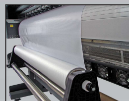
Fácil montaje del material con sistema de tensión ajustable.